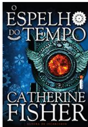
O espelho do tempo Catherine Fisher