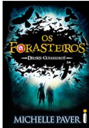
Os forasteiros Michelle Paver