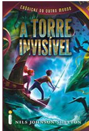
A torre invisível Nils Johnson-Shelton