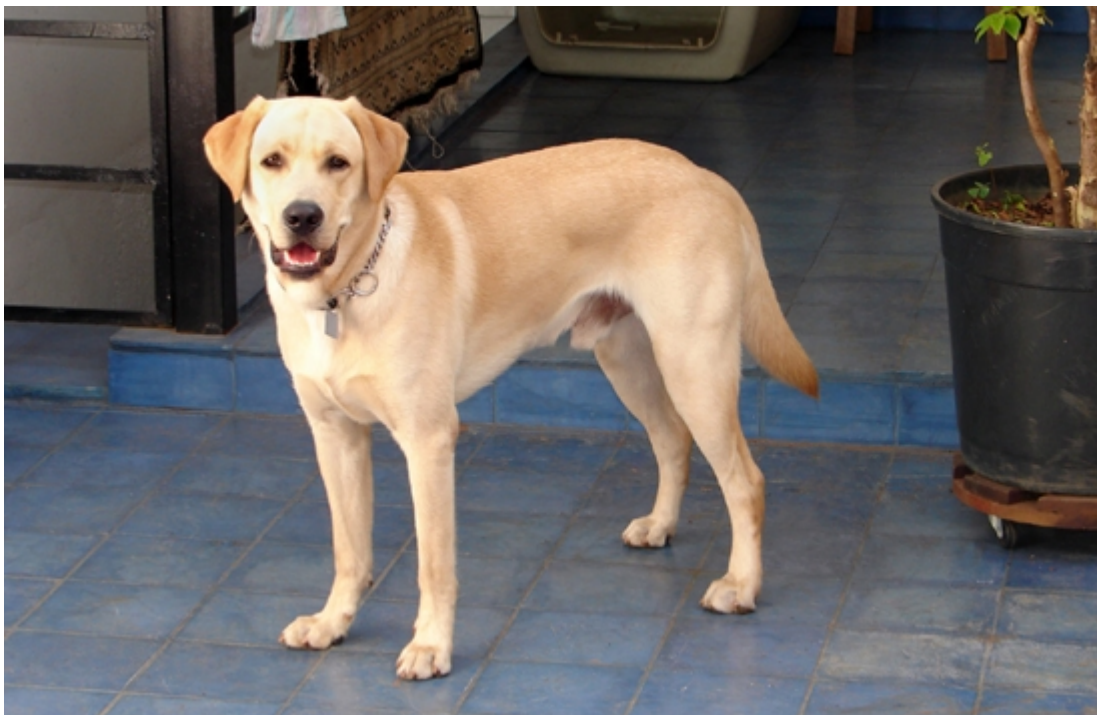
Boris amava um flash. Incrível como ele posava para fotos....