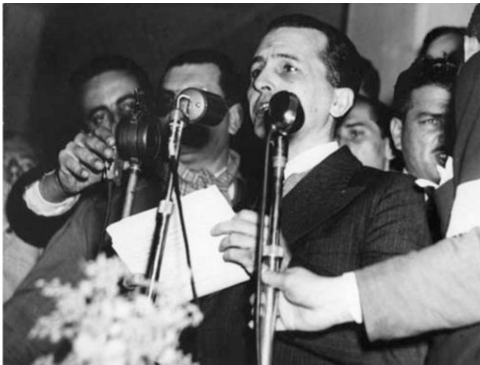
Preso em março de 1936, Luis Carlos Prestes passaria nove anos no cárcere. Na foto, discursa em comício do Partido Comunista no Pacaembu, em julho de 1945.

Em relação à Segunda Guerra Mundial, àquela altura próxima do desfecho, previu a vitória moral da Grã-Bretanha, graças à nobreza de caráter de seus habitantes. Aos Estados Unidos caberia a vitória em termos comerciais, tornando-o “senhor de todos os mercados”. Já a União Soviética seria, de acordo com Lobato, a vencedora número um no novo jogo de equilíbrio entre as nações hegemônicas: “Pois daqui por diante não se dará um só passo político sem ter em conta a Rússia”, garantiu, lembrando que até meses atrás o regime comunista não poderia sequer ser mencionado em nossos jornais.