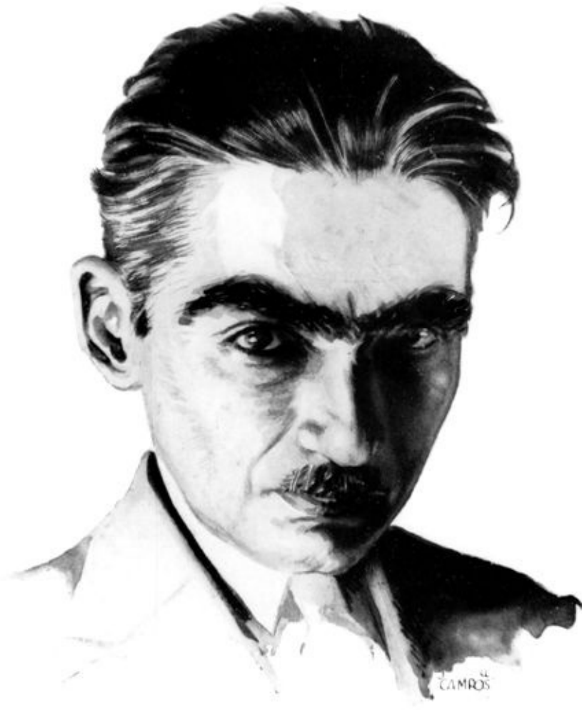
Monteiro Lobato, por J.U. Campos.