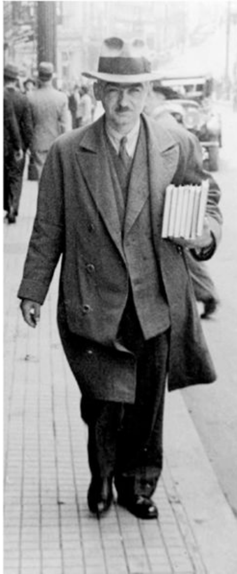
Lobato, centro de São Paulo, anos 40

Concedidas aos principais órgãos de imprensa, as entrevistas reunidas no presente volume datam da década de 1940 e remetem aos anos finais de Monteiro Lobato. Cobrem o período do Estado Novo, quando ele representava uma das vozes mais requisitadas pelos repórteres na tentativa de romper o duro cerco da censura imposta aos veículos de comunicação. Algumas estendem-se à fase inicial da abertura democrática, em que já havia liberdade para publicar declarações em outros tempos passíveis inclusive de cadeia: “Acho que a grande coisa que a ditadura de Getúlio Vargas fez, e pela qual temos de lhe ser gratíssimos, foi preparar Carlos Prestes para a sua grande missão por meio dum