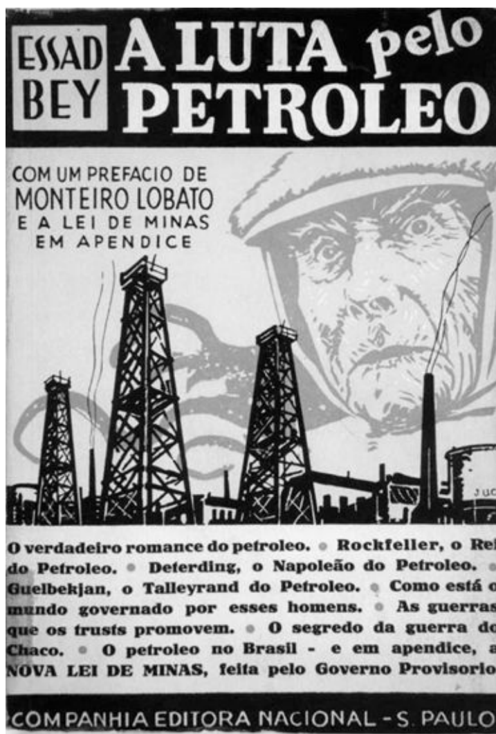
A luta pelo petróleo, Essad Bey , tradução de Monteiro Lobato