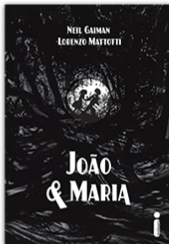
João e Maria