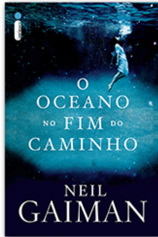
O oceano no fim do caminho