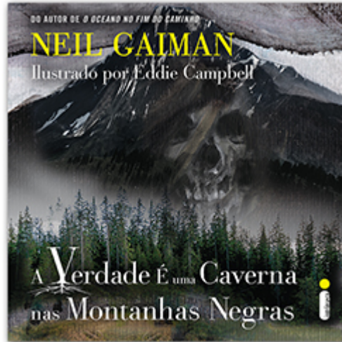
A verdade é uma caverna nas Montanhas Negras