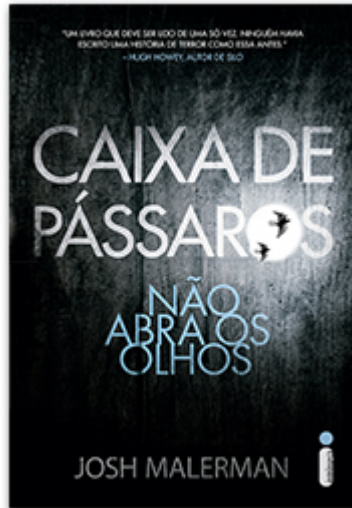
Caixa de pássaros Josh Malerman