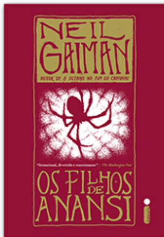
Os filhos de Anansi