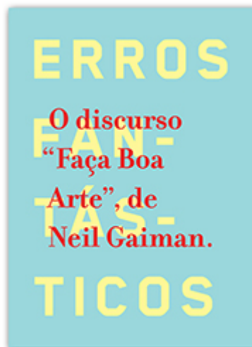
Faça boa arte