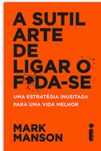
A sutil arte de ligar o f* da-se Mark Manson