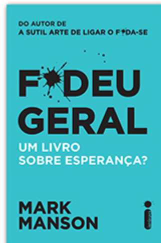
F*deu geral Mark Manson