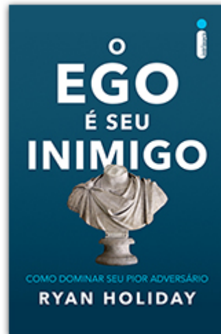
O ego é seu inimigo Ryan Holiday