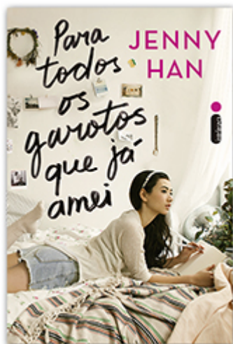
Para todos os garotos que já amei (Livro 1)