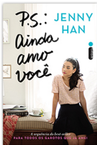
P.S.: Ainda amo você (Livro 2)