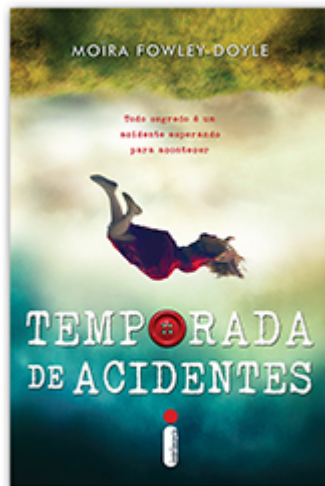
Temporada de accidentes Moira Fowley-Doyle