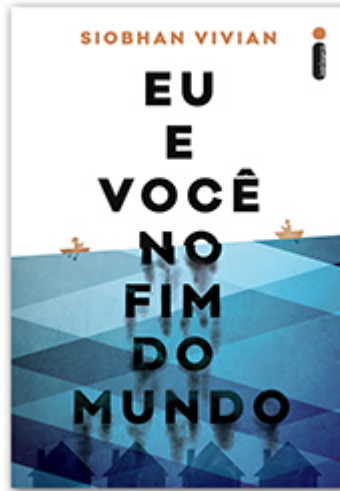
Eu e você no fim do mundo Siobhan Vivian