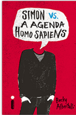
Simon vs. a agenda homo sapiens Becky Albertalli