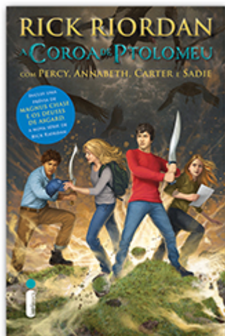
A coroa de Ptolomeu