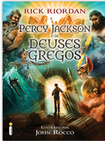
Percy Jackson e os deuses gregos