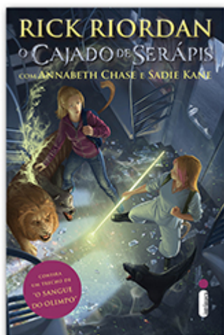
O cajado de Serápis