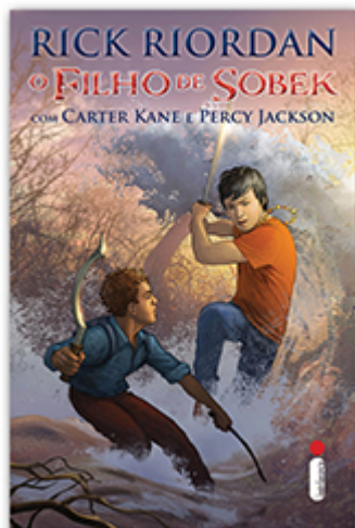
O filho de Sobek