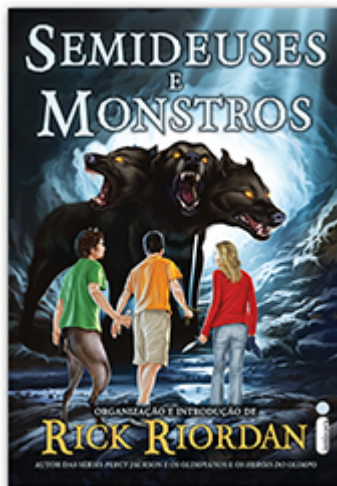
Semideuses e monstros Organização e introdução de Rick Riordan