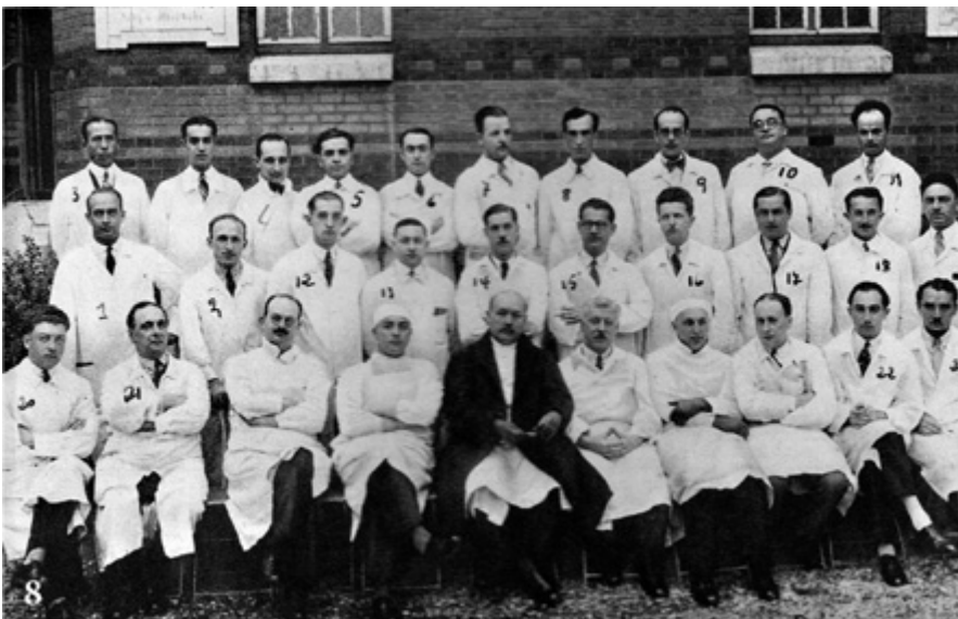
Paris, 1930: JK, o segundo da última fila, da esquerda para a direita, e demais alunos do célebre urologista francês Maurice Chevassu.