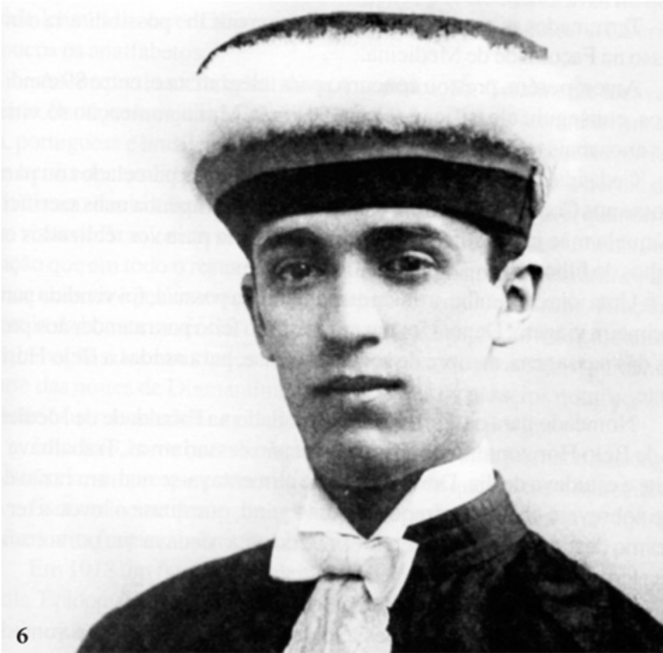
Belo Horizonte, dezembro de 1927: doutor Juscelino Kubitschek de Oliveira, formatura em medicina.