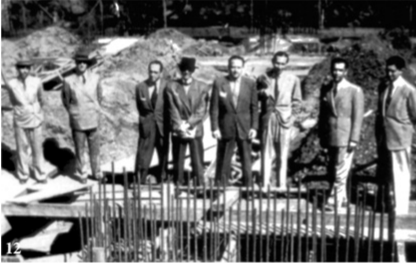
Belo Horizonte, 1943: Juscelino (de chapéu preto), o prefeito furacão, inspeciona obras da Pampulha. À direita dele, de gravata escura, o arquiteto Oscar Niemeyer.