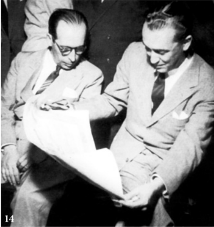
Os velhos amigos Zé da Véia (José Maria Alkmin, ministro da Fazenda) e Nonô (presidente JK) no auge do poder.