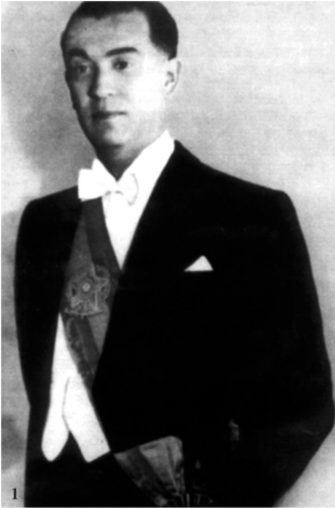
Presidente Juscelino Kubitschek de Oliveira (1956-1961).