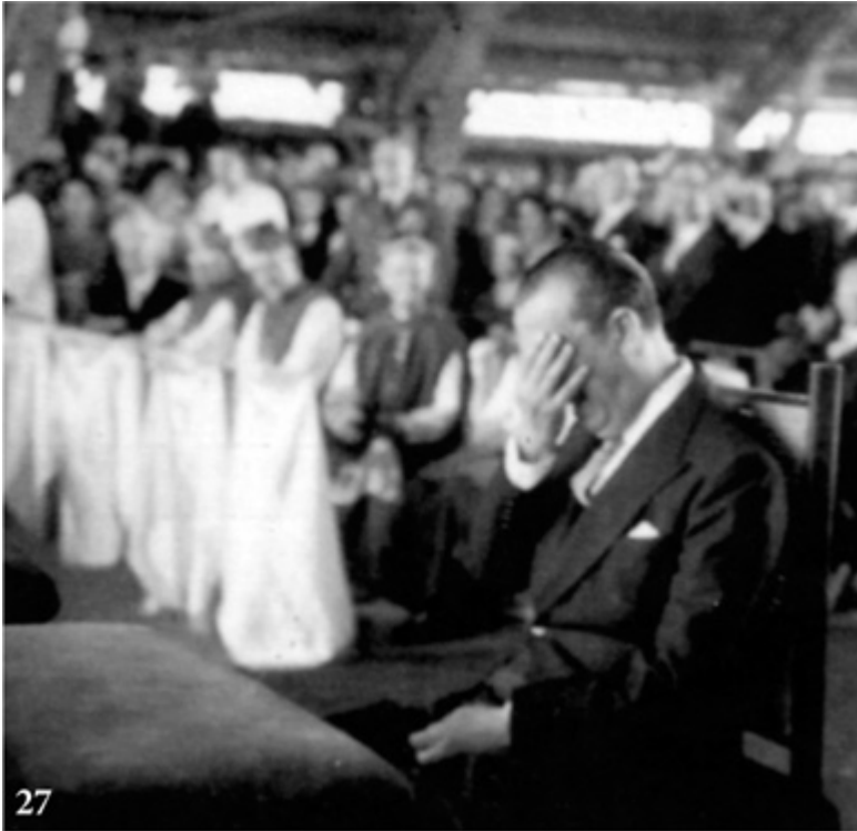
21 de abril de 1960, inauguração de Brasília: JK chora durante a missa.