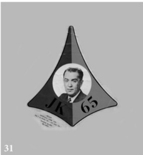
JK-65: sonho da reeleição ganhou as ruas cedo demais.