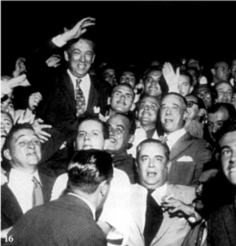
Belo Horizonte, 1951: o governador Juscelino carregado por admiradores.