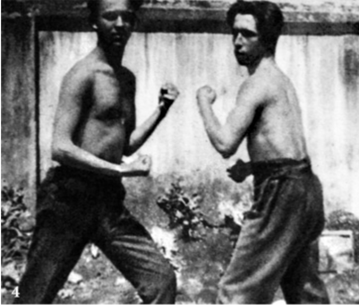
Juscelino, o Nonô (esq.), e seu futuro ministro da Fazenda, José Maria Alkmin, o Zé da Véia.