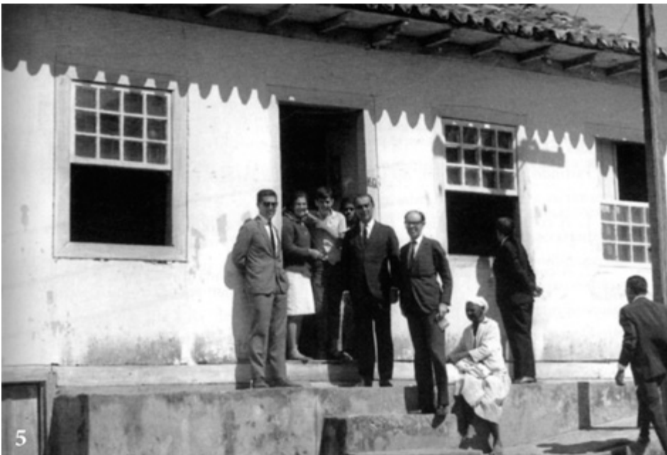
Presidente JK em visita à casa de porta e três janelas de sua infância, na rua São Francisco, Diamantina.