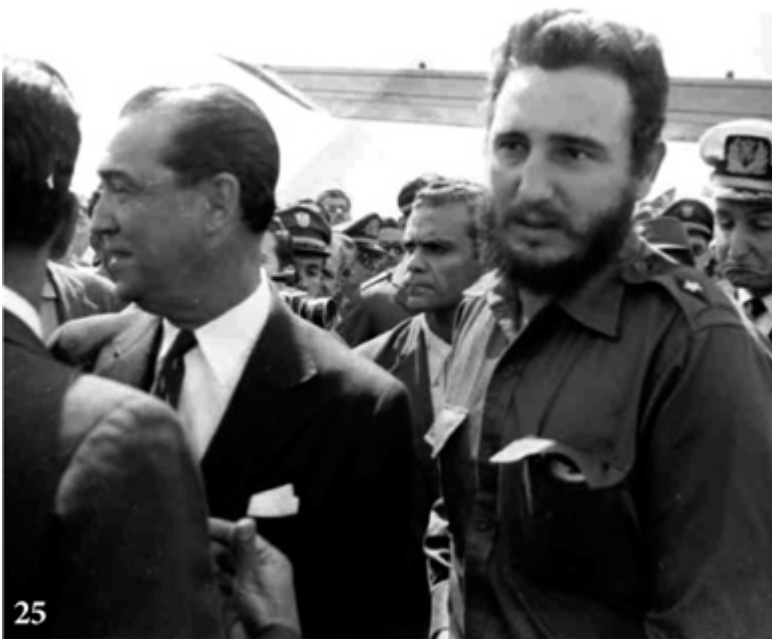
Brasília, abril de 1959, Fidel Castro a JK: "É uma felicidade ser jovem neste país."