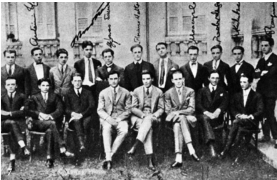
Belo Horizonte, dezembro de 1927: JK, o segundo, de pé, da direita para a esquerda, e demais formandos da Faculdade de Medicina.