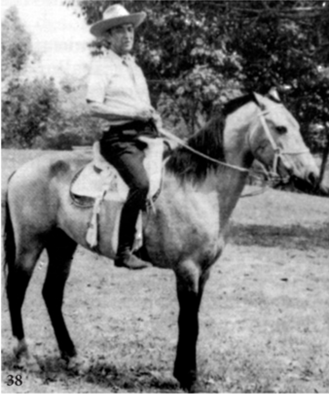
Urbaníssimo, tentou virar fazendeiro em Goiás.