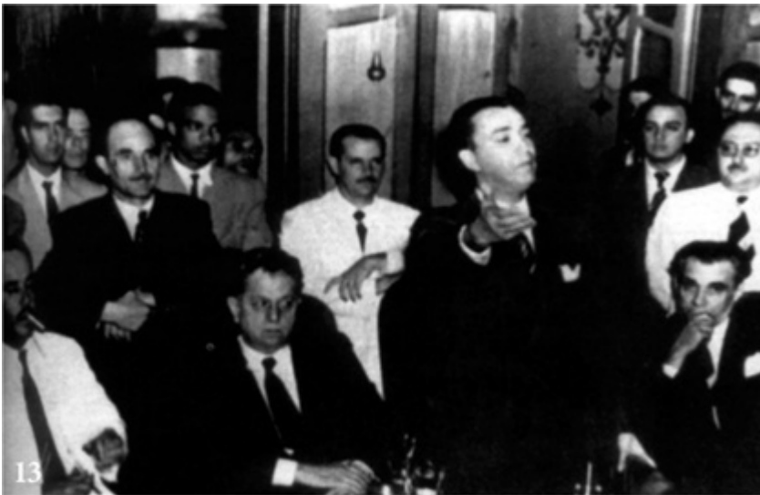
Rio de Janeiro, 1946: o deputado federal constituinte Juscelino Kubitschek discursa em reunião do PSD.