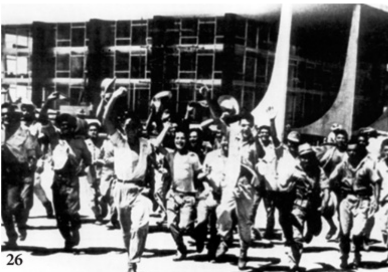
Praça dos Três Poderes, inauguração de Brasília, 21 de abril de 1960: alegria dos candangos.