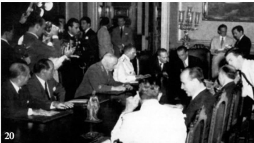
Rio de Janeiro, Palácio do Catete, 1º de fevereiro de 1956, primeira reunião ministerial: liberdade de imprensa, fim do estado de sítio, Conselho de Desenvolvimento e Programa de Metas.