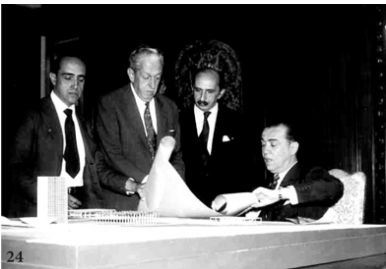
Darcy Ribeiro, ateu: "Deus estava de muito bom humor quando reuniu JK, Israel Pinheiro, Niemeyer e Lúcio Costa para fazer Brasília".