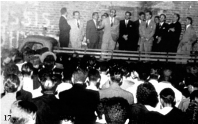
Jataí, Goiás, 4 de abril de 1955. Discursando da carroceria de velho caminhão, o candidato a presidente Juscelino anuncia compromisso de mudar a capital para o Planalto Central, caso se eleja.