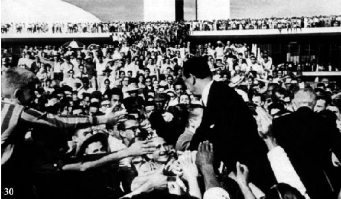
Brasília, Congresso Nacional, 13 de julho de 1961: presença do senador Juscelino Kubitschek de Oliveira.