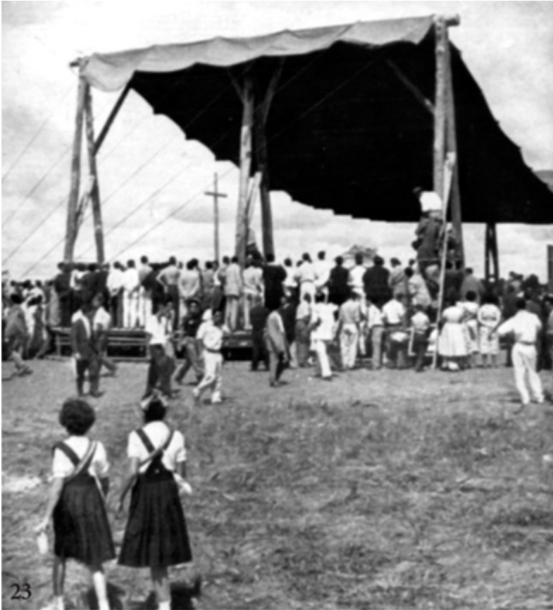
Primeira missa em Brasília, 3 de maio de 1957: toldo improvisado caiu logo depois.