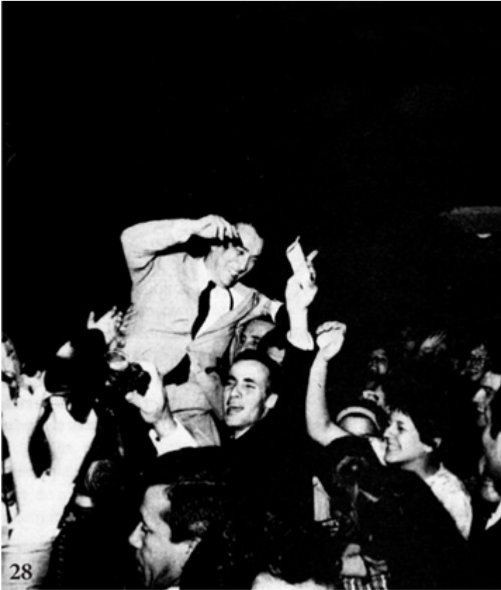
Junho de 1961: JK é eleito senador por Goiás.