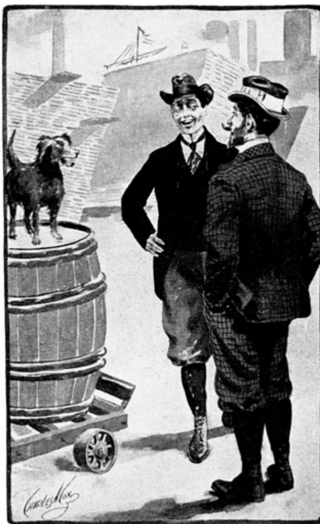
“Caímos num incontrolável acesso de riso.” [Charles A. Cox, The Sign of the Four , Chicago/Nova York, The Henneberry Company, s.d.]

Sherlock Holmes e eu nos entreolhamos, perplexos, e em seguida caímos simultaneamente num incontrolável acesso de riso.