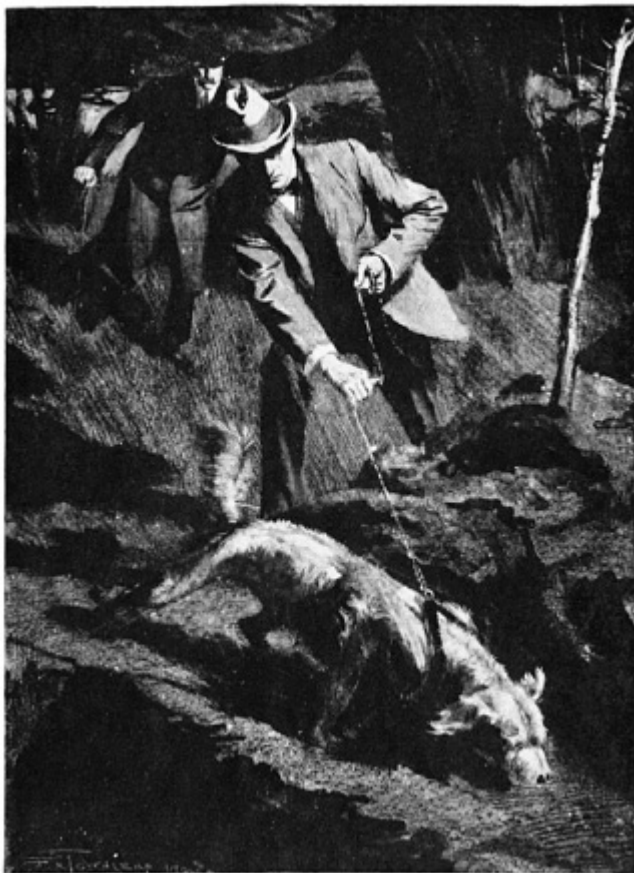
"Pôs-se a correr pelo rastro." [F.H. Townsend, The Sign of Four , Londres, George Newnes, Ltd., 1903]

Ao chegar ao muro limítrofe, Toby correu, ganindo ansiosamente, ao longo de sua sombra, e finalmente parou num canto protegido por uma jovem faia. Onde os dois muros se encontravam, vários tijolos haviam sido arrancados e as fendas restantes estavam gastas e arredondadas no lado de baixo, como se tivessem sido usadas frequentemente como escada. Holmes subiu e, tomando o cachorro de mim, jogou-o do outro lado.